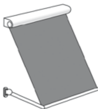
FF Fallarmmarkise mit federunterstützten Fallarmen