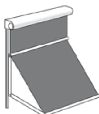
FMG Markisolette mit federunterstützten Markisolettenarmen