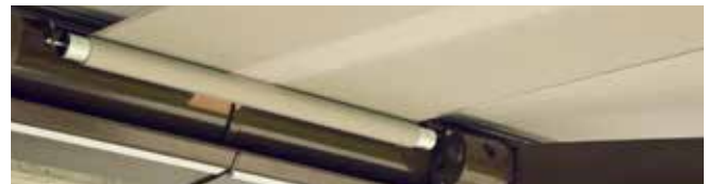
Optional mit Schlitzabdeckung bei gekoppelten Anlagen