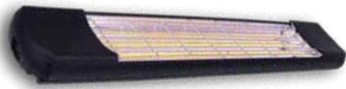
Optional mit Heizstrahler io

Alle sichtbaren Aluminiumteile sind pulverbeschichtet und in drei Standardfarben oder optional in Sonderfarben erhältlich.